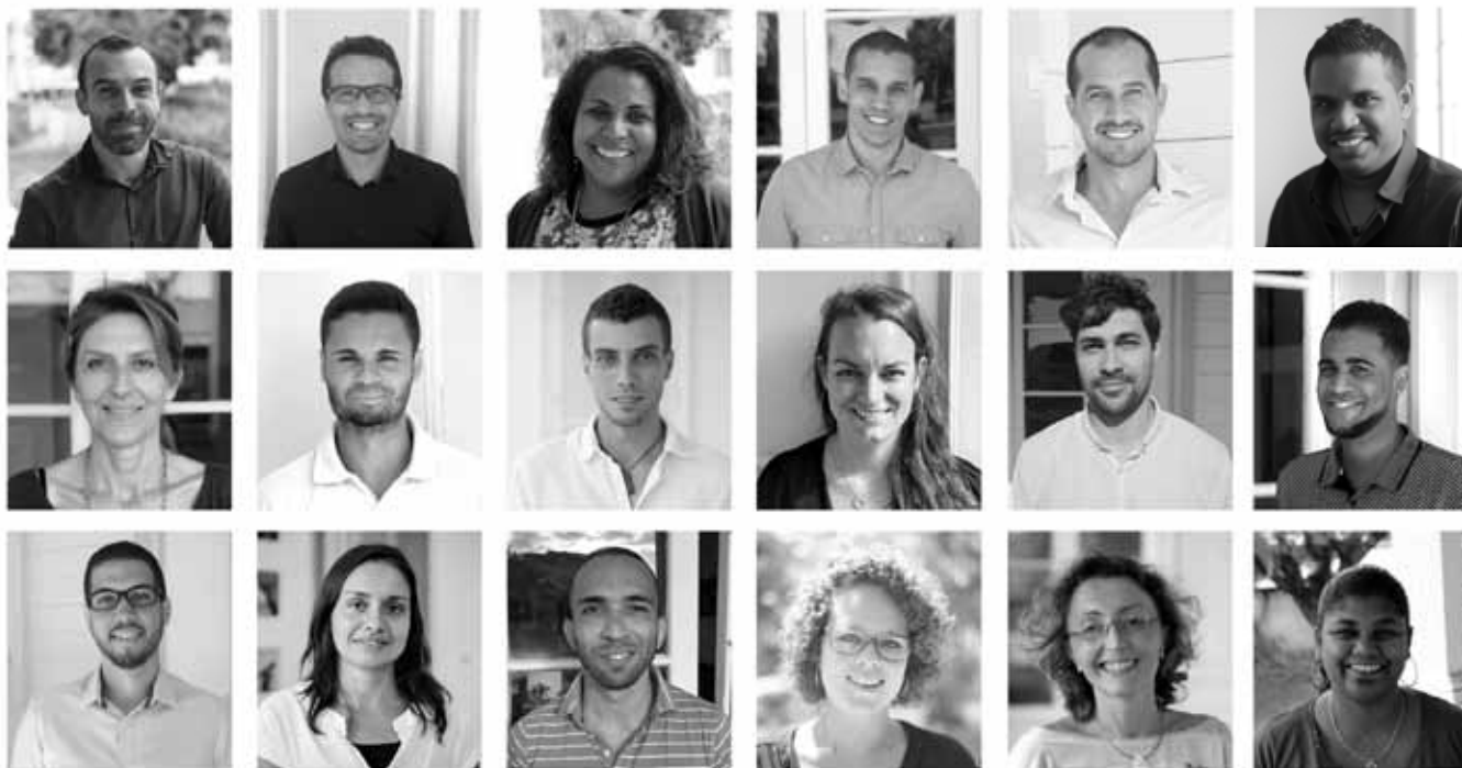
L'équipe en 2023

C'est une philosophie fondatrice de l'agence qui se retrouve également dans une co-direction unique à l'échelle de La Réunion.