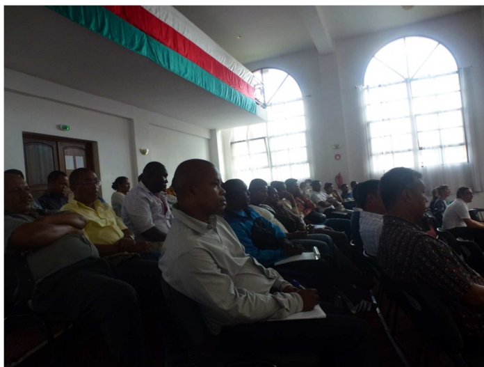
Réunion d'échanges avec les services urbains d'Antananarivo