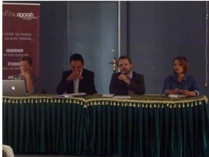
Réunion de lancement de l'étude de préfiguration d'une agence d'urbanisme malgache (Antananarivo et communes périphériques)