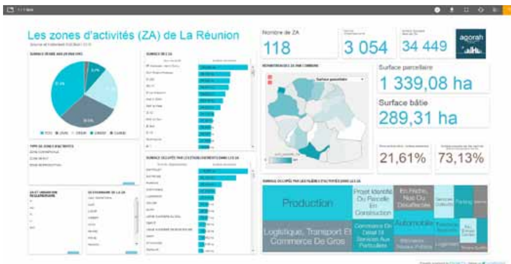
FIGURE 2 : TABLEAU DE BORD DES ZONES D'ACTIVITÉS

Parallèlement, les portails de diffusion de la connaissance sont encore mal connus et identifiés, dans un contexte actuel où le citoyen a besoin de plus d'informations.