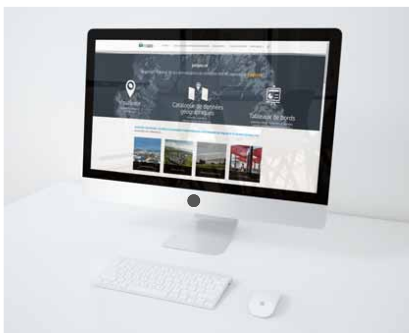
FIGURE 1: PAGE D'ACCUEIL DE LA PLATEFORME PEIGEO

Il est prévu désormais de valoriser les bases de données issues de l'ensemble des Observatoires de l'AGORAH. Conscient que l'accès aux données peut constituer un avantage compétitif notamment pour générer des économies sur des services existants et/ou nouveaux, l'AGORAH souhaite s'inscrire dans une stratégie de différenciation intelligente de contribuer à l'essor économique de La Réunion.