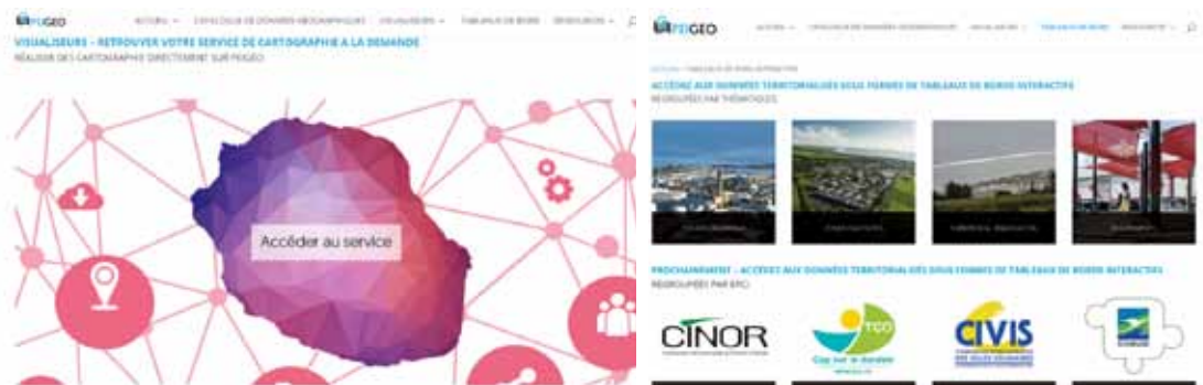
FIGURE 3 : CONTENU DU SITE WWW.PEIGEO.RE

Les services innovants mis en oeuvre peuvent également contribuer à améliorer la compétitivité des administrations publiques et des acteurs économiques réunionnais.