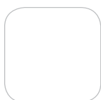
SYLVAIN POULAIN GISSCAN

“ L'acquisition de données est un facteur clé des SIG, mais elle s'est révélée être un défi lors de la réalisation de projets dans la région de l'Océan Indien et d'Afrique. L'accès limité ou inexistant à l'information peut être un réel problème avant même de démarrer un projet. Les méthodes et les moyens traditionnels d'acquisition de données qui ont fait leurs preuves ont souvent été remis en question en raison des caractéristiques et des besoins locaux. Ces problèmes constituaient des contraintes pour la planification et la budgétisation. Si dans certains pays, l'acquisition de données n'est qu'une simple formalité, les mêmes méthodes éprouvées peuvent avoir des limites dans d'autres pays; l'adaptation s'avère dans ce cas indispensable au succès d'un projet. Face à ces défis, nous avons revu nos méthodes de travail pour être plus en phase avec les réalités terrain tout en respectant les contraintes de temps et de budget. Défis terrain rencontrés :